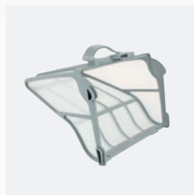
Filterkorb (60μ) Leicht zugänglich und mit großem Fassungsvermögen (5 Liter)